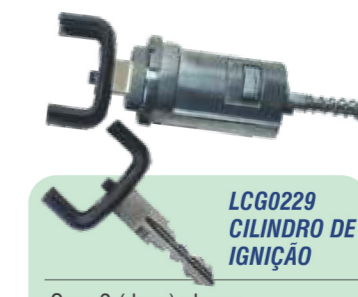
LCG0229 CILINDRO DE IGNIÇÃO