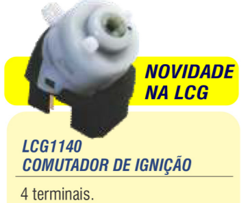
NOVIDADE NA LCG LCG1140 COMUTADOR DE IGNIÇÃO