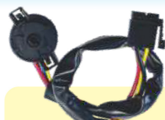
LCG1127 COMUTADOR DE IGNIÇÃO

FORD / VW Escort, Verona 93/96; Volkswagen - Logus, Pointer após 92