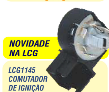
NOVIDADE NA LCG LCG1145 COMUTADOR DE IGNIÇÃO