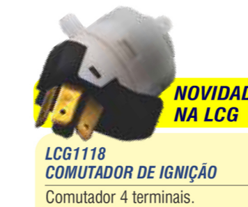
NOVIDADE NA LCG LCG1118 COMUTADOR DE IGNIÇÃO