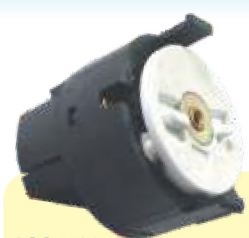
LCG1132 COMUTADOR DE IGNIÇÃO

FIAT Uno, Mille, Fiorino após 02, Palio e Weekend, Siena, Strada 96/03, Marea, Brava