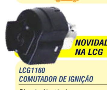
NOVIDADE NA LCG LCG1160 COMUTADOR DE IGNIÇÃO