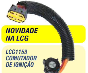
NOVIDADE NA LCG LCG1153 COMUTADOR DE IGNIÇÃO