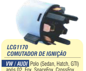
LCG1170 COMUTADOR DE IGNIÇÃO

VW / AUDI Polo (Sedan, Hatch, GTI) após 02, Fox, SpaceFox, CrossFox após 03, Gol, Saveiro, Voyage após 08, Golf após 98, Passat/Variant 98/05, Bora, New Beetle e Caminhões Constellation - Audi - A3 99/06 / .