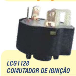
LCG1128 COMUTADOR DE IGNIÇÃO