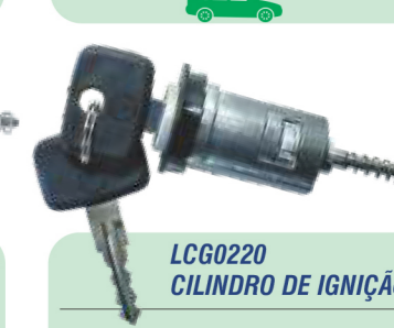
LCG0220 CILINDRO DE IGNIÇÃO