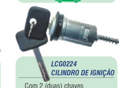
LCG0224 CILINDRO DE IGNIÇÃO