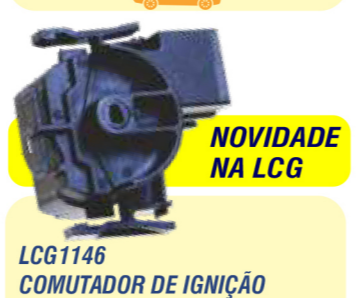
NOVIDADE NA LCG LCG1146 COMUTADOR DE IGNIÇÃO