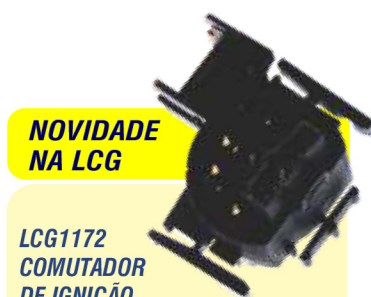
NOVIDADE NA LCG LCG1172 COMUTADOR DE IGNIÇÃO

GM Meriva, Novo Corsa após 02, Montana até 10