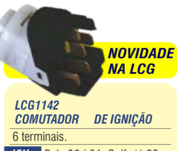
NOVIDADE NA LCG LCG1142 COMUTADOR DE IGNIÇÃO