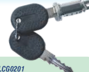
LCG0201 CILINDRO DE IGNIÇÃO