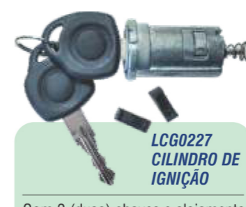
LCG0227 CILINDRO DE IGNIÇÃO

Com 2 (duas) chaves e alojamento para transponder