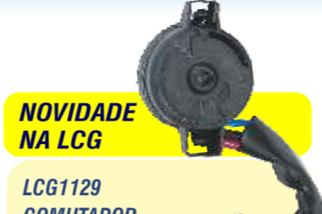
NOVIDADE NA LCG LCG1129 COMUTADOR DE IGNIÇÃO

FORD Ka, Fiesta, Courier após 96, EcoSport