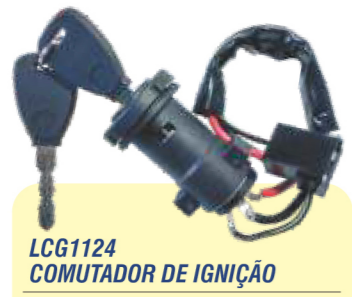
LCG1124 COMUTADOR DE IGNIÇÃO

Chicote curto, cilindro de chaves, conector com 3 terminais