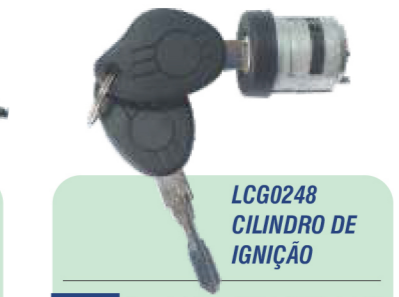
LCG0248 CILINDRO DE IGNIÇÃO