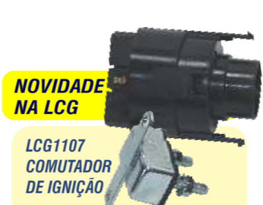
NOVIDADE NA LCG LCG1107 COMUTADOR DE IGNIÇÃO

SCANIA Caminhões séries 112 e 142 - 81/90