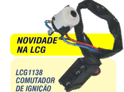
NOVIDADE NA LCG LCG1138 COMUTADOR DE IGNIÇÃO