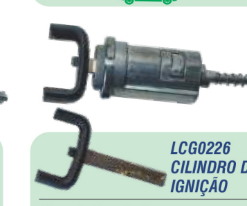
LCG0226 CILINDRO DE IGNIÇÃO