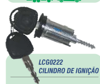
LCG0222 CILINDRO DE IGNIÇÃO

Nº Original: 307.905865.1 88EU.11572.A.B1