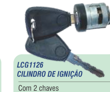
LCG1126 CILINDRO DE IGNIÇÃO