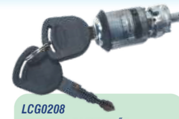
LCG0208 CILINDRO DE IGNIÇÃO