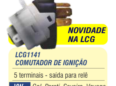
NOVIDADE NA LCG LCG1141 COMUTADOR DE IGNIÇÃO