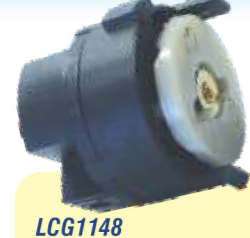
LCG1148 COMUTADOR DE IGNIÇÃO