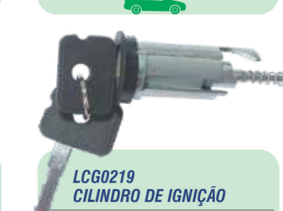
LCG0219 CILINDRO DE IGNIÇÃO