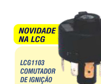
NOVIDADE NA LCG LCG1103 COMUTADOR DE IGNIÇÃO