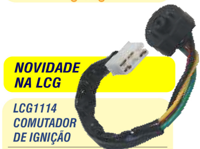
NOVIDADE NA LCG LCG1114 COMUTADOR DE IGNIÇÃO