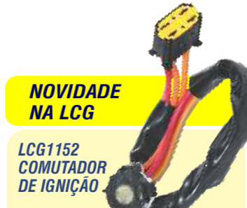
NOVIDADE NA LCG LCG1152 COMUTADOR DE IGNIÇÃO