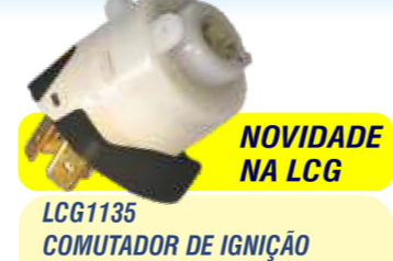
NOVIDADE NA LCG LCG1135 COMUTADOR DE IGNIÇÃO

Nº Original: 89FB.11572.AB 2S65.11572.AA