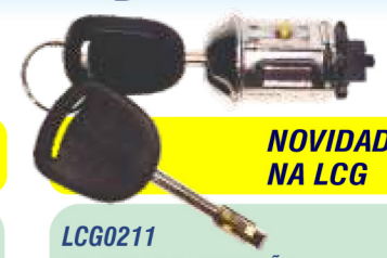
NOVIDADE NA LCG LCG0211 CILINDRO DE IGNIÇÃO