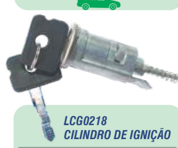
LCG0218 CILINDRO DE IGNIÇÃO