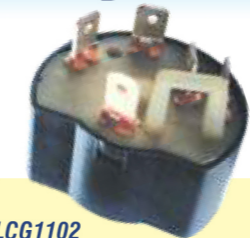
LCG1102 COMUTADOR DE IGNIÇÃO