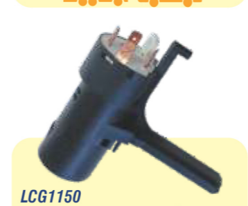
LCG1150 COMUTADOR DE IGNIÇÃO

GM Celta, Prisma até 12, Corsa Classic após 05