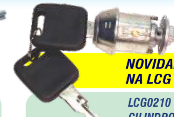
NOVIDADE NA LCG LCG0210 CILINDRO DE IGNIÇÃO