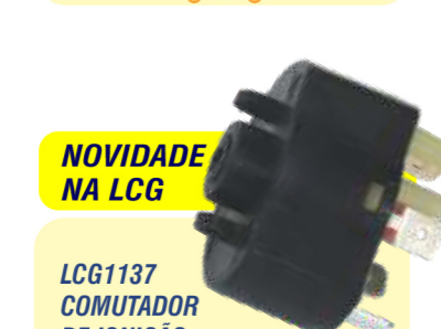
NOVIDADE NA LCG LCG1137 COMUTADOR DE IGNIÇÃO

GM Omega, Suprema, Pick-up D20, caminhão A40 após 93