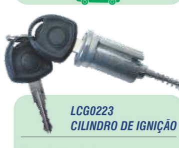
LCG0223 CILINDRO DE IGNIÇÃO