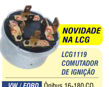
NOVIDADE NA LCG LCG1119 COMUTADOR DE IGNIÇÃO

VW / FORD Ônibus 16-180 CO, 16-210 CO, Ford - Caminhão Cargo