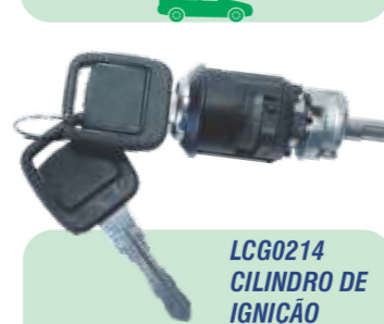
LCG0214 CILINDRO DE IGNIÇÃO