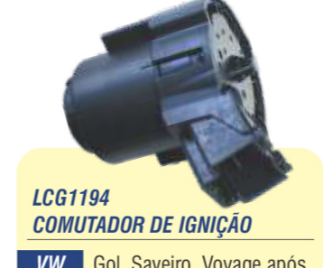
LCG1194 COMUTADOR DE IGNIÇÃO

VW Gol, Saveiro, Voyage após 13, Fox, Crossfox, Spacefox, Space Cross após 12, Up!, Amarok, Gol G6